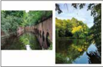
Fort IXa, ulica 28 Czerwca 1956 roku Park Dębina