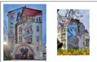
Ulica Słowackiego 62, mural, projekt Radosław Barek, wykonanie Studio Murall Mural Outer Space 2013, autor Marina Zumi