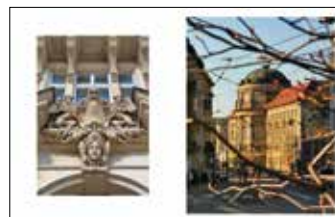
Plac Cyryla Ratajskiego Collegium Maius, ulica Fredry