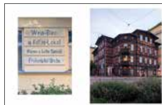
Odsłonięte napisy przy ulicy Fabrycznej Dom fachwerkowy, zbieg ulic Sikorskiego i Przemysłowej