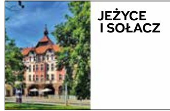
Budynek Teatru Nowego, ulica Dąbrowskiego