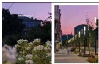
Budynek Arkadii przy placu Wolności