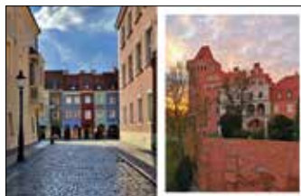
Domy budnicze, Stary Rynek