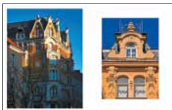
Zbieg ulic Wielkiej i Szewskiej