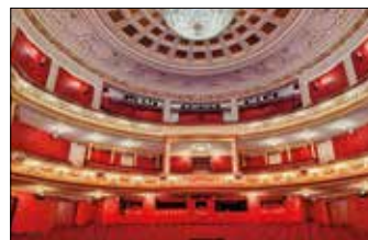
Wnętrze Teatru Wielkiego