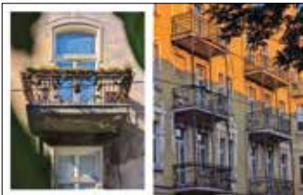
Detale secesyjnej zabudowy, ulica Krasieńskiego Ulica Kraszewskiego