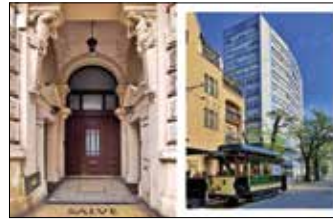
Ulica Dąbrowskiego 69 Ulica Gajowa