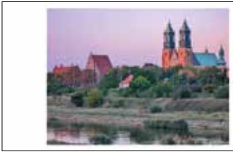
Widok na Ostrów Tumski