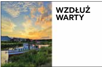
Widok na Stary Port rzeczny