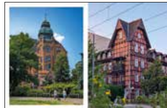
Budynek Rektoratu Politechniki Poznańskiej Kamienica fachwerkowa, róg ulic Wierzbicęce i Świętego Czesława