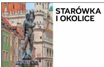
Fontanna Apolla, Stary Rynek