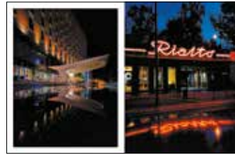
Hotel Mercure Neon kina Rialto, ulica Dąbrowskiego