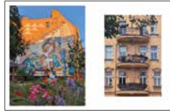
Ulica Jeżycka 36, mural, projekt Dorota Piechocińska, wykonanie Murall Studio Ulica Dąbrowskiego 39