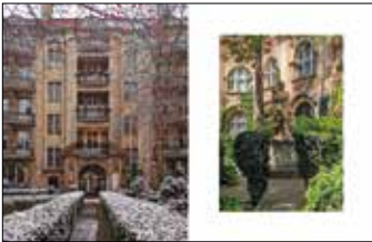
Dziedziniec PTPN, ulica Mielżyńskiego Pomnik na dziedzińcu PTPN, ulica Mielżyńskiego