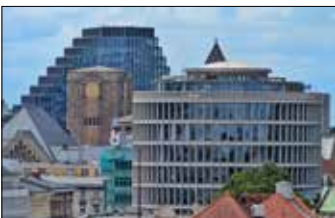
Widok z wieży zamku królewskiego na Okrągłak, Centrum Kultury „Zamek” i biurowiec Bałtyk