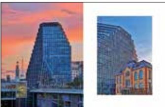
Biurowiec Bałtyk Budynek dawnej drukarni Concordia, biurowiec Bałtyk w tle