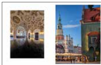
Sala Renesansowa poznańskiego ratusza