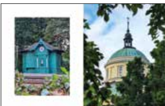
Zabytkowa poczekalnia tramwajowa, park Sołacki Kościół pw. Świętego Jana Vianneya