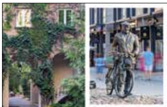
Dziedziniec klasztoru Dominikanów, ulica Kościuszki 99