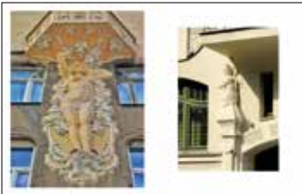
Detal secesyjny, ulica Roosevelta 4 Detal secesyjny, ulica Poznańska 50