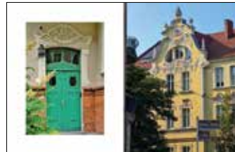
Ulica Poplińskich 3 Willi Bajerlaina, ulica Żupańskiego 10