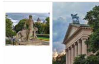
Teatr Wielki im. Stanisława Moniuszki