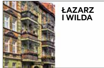
Ulica Prądyńskiego 47