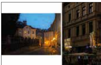
Ulica Góra Przemysła