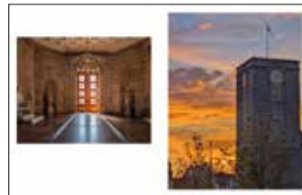
Centrum Kultury „Zamek”, ulica Święty Marcin