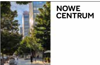
Ulica Święty Marcin, modernistyczne biurowce Alfry