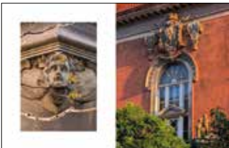
Ulica Mickiewicza Dom Tramwajarza, ulica Słowackiego