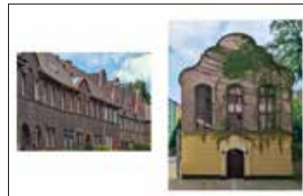
Kolonia robotników kolejowych, zbieg ulic Hutniczej i Wspólnej Zbór baptystyczny Koinonia, ulica Przemysłowa 48a