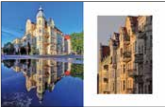
Zbieg ulic Mickiewicza i Kochanowskiego Kamienica przy rynku Jeżyckim