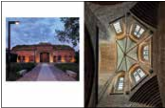
Galeria Śluza, Ostrów Tumski Katedra poznańska