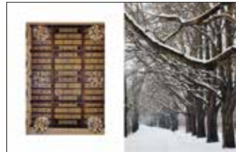
Collegium Rungego, ulica Wojska Polskiego 52 Aleja Wielkopolska