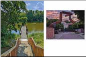
Stawy Browarne Ulica Posadzego