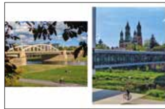
Most Świętego Rocha Śluza Katedralna z katedrą w tle