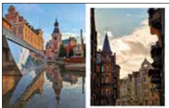
Plac Kolegiacki z zabudowaniami dawnego kolegium jezuickiego