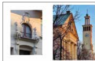
Detal secesyjny, ulica Kilińskiego 5 Kościół Zmartwychwstania Pańskiego