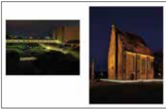
Przejście nad Cybiną, Brama Poznania Kościół pw. Najświętszej Marii Panny in Summo