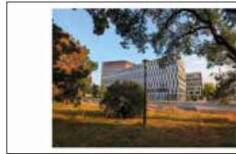
Biurowce przy Nowym Rynku