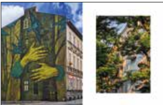
Ulica Wawrzyniaka 14, mural, projekt Dorota Piechocińska, wykonanie Grupa Murall Ulica Szamarzewskiego