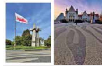
Plac Adama Mickiewicza