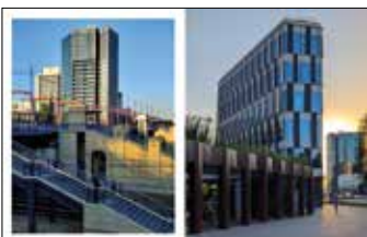
Schody prowadzące do dworca kolejowego z wieżowcem mieszkalnym w tle Część zabudowy przy Nowym Rynku