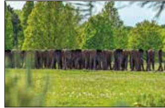
Nierozpoznani – instalacja rzeźbiarska Magdaleny Abakanowicz, Park Cytadela