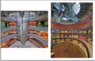
Stary Browar, wnętrza