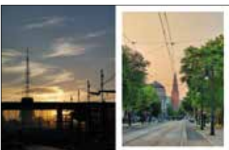
Międzynarodowe Targi Poznańskie Ulica Fredry