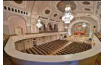
Aula Uniwersytecka przy placu Mickiewicza