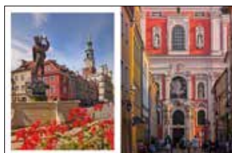
Stary Rynek z fontanną Apolla i ratuszem w tle