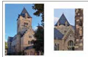
Centrum Kultury „Zamek”, ulica Święty Marcin