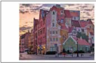
Mural Opowieść śródecka z trębaczem na dachu i kotem w tle, autor Radosław Barek