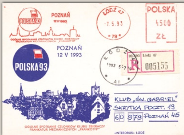
38. Pamiątkowa kartka pocztowa z frankaturą stosowaną w Łodzi w maju 1993 roku i zawierającą ilustrację z panoramą Poznania